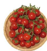
ブランドミニトマト 優糖星（印南町）