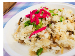
までごはん（印南町）