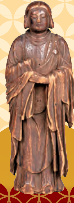
聖徳太子孝養立像