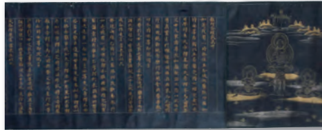
雑阿含経 巻第四十 平安時代後期