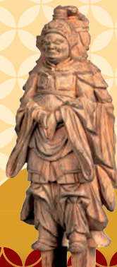
双身毘沙門天立像