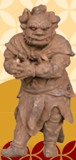
持国天・増長天眷属立像