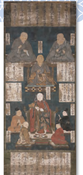
和朝太子先徳連坐像 室町時代 大阪・本照寺