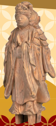
双身毘沙門天 立像