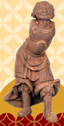
十二神将立像のうち亥神