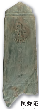
阿弥陀如来種子 板碑 南北朝・永徳2年(1382)