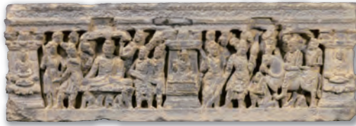
仏伝浮彫「出城・降魔成道」 ガンダーラ 2~3世紀