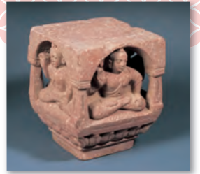
四面仏坐像 マトゥラー 2世紀 龍谷大学 龍谷ミュージアム