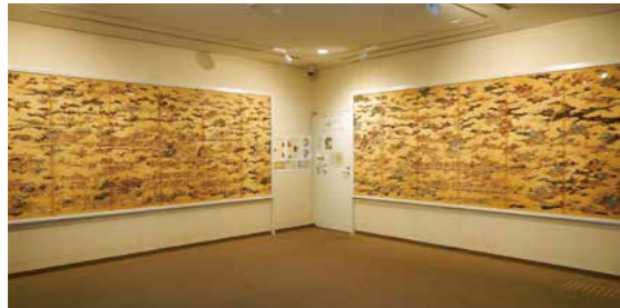
「国宝 上杉本 洛中洛外図屏風」の複製パネル

講座は、パネル前にて開催する「パネルトーク」と、特定のテーマを取り上げて開催する座学の「ギャラリートーク」の2種類。参加は無料です。不定期開催ですが、おおよそ月に1回のペースで開催しています。