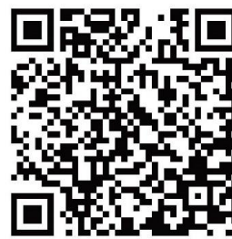
「アクセス・スクールバスダイヤ」