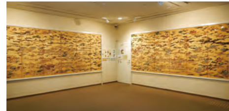
「国宝 上杉本 洛中洛外図屏風」の 複製パネル

こちらのパネルは常時展示していますが、より深く知っていただ くために、当センターガイドを講師として「洛中洛外図の基礎講座 パネルで見る上杉本 洛中洛外図」を開催し ています。